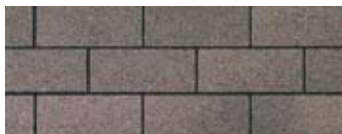
Driftwood · Bois flottant