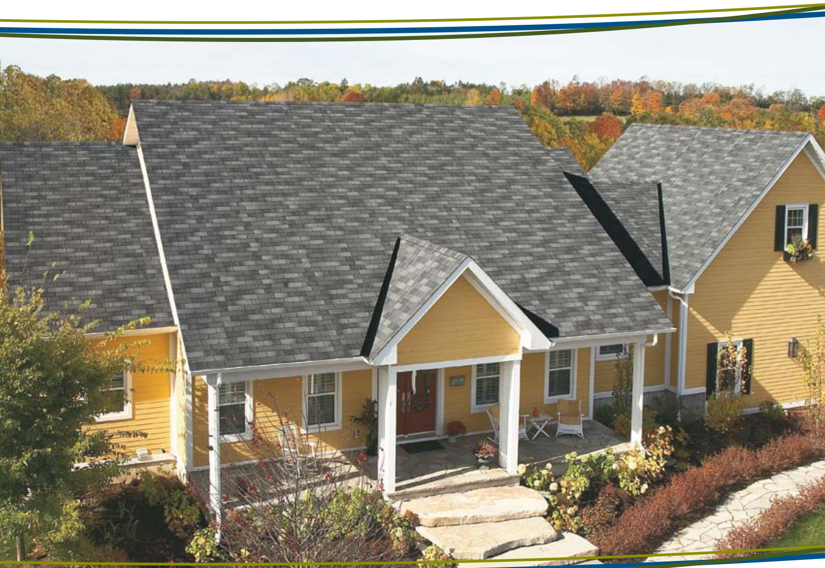
Colour featured is Slate - Couleur illustrée : Ardoise