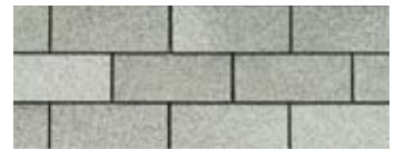
Dual Grey · Gris double