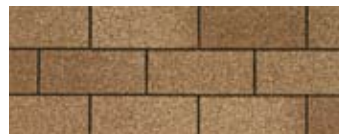
Earthtone Cedar · Cèdre « Earthtone »