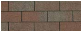
Aged Redwood · Séquoia vieilli