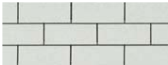
White · Blanc