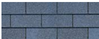
National Blue** · Bleu national**