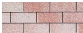
Rainbow Red · Rouge arc-en-ciel