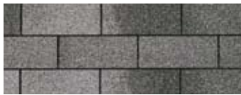
Charcoal Grey · Gris charbon