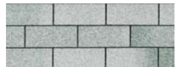
Rainbow Green · Vert arc-en-ciel

Find out more about our products now by talking to a CRC Sales Representative, your professional roofing contractor or contact us directly at: