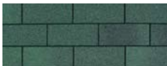
Forest Green · Vert forêt