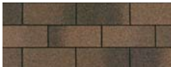
Dual Brown · Brun double