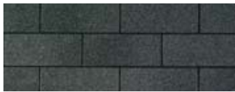
Dual Black · Noir double