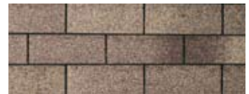
Weatherwood · Bois de grange