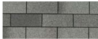
Slate 3 · Ardoise 3