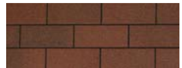
Riviera Red · Rouge riviera