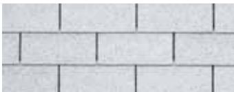
Super White - Super blanc