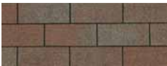
Aged Redwood - Séquoia vieilli