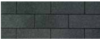
Dual Black - Noir double