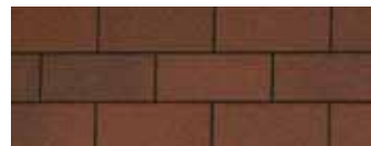
Riviera Red - Rouge riviera