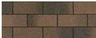
Dual Brown - Brun double