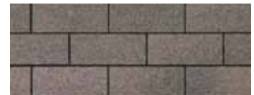
Driftwood - Bois flottant