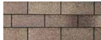
Weatherwood - Bois de grange