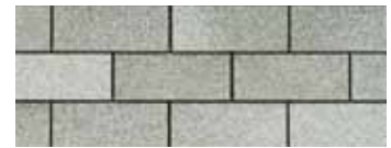
Dual Grey - Gris double