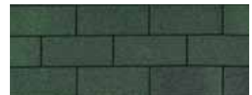
Vintage Green - Vert antique