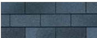
National Blue** - Bleu national**