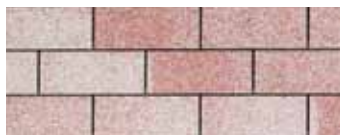
Rainbow Red - Rouge arc-en-ciel