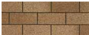
Earthtone Cedar - Cèdre « Earthtone »