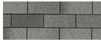
Slate 3 - Ardoise 3