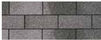
Charcoal Grey - Gris charbon