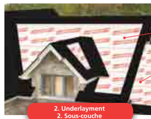
2. Underlayment 2. Sous-couche

Fournissent une deuxième ligne de défense contre les infiltrations d'eau causées par les digues de glace ou les pluies violentes qui risquent de provoquer de coûteux dommages.