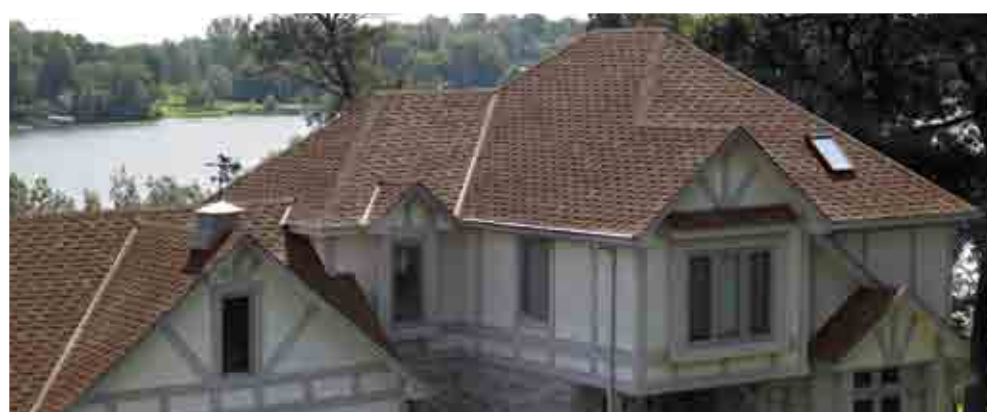
Colour Featured: Western Redwood · Couleur illustrée: Séquoia de l'Ouest

Armourshake a l'apparence du véritable bardeau de fente et se distingue par sa capacité à protéger votre toit contre les éléments féroces de la nature. En aussi peu que cinq ans, un toit de bois véritable peut tourner au gris à mesure que le soleil lui subtilise sa résine naturelle. Le bardeau Armourshake, lui, détourne les durs rayons du soleil, résiste à la prolifération des algues et garde sa belle apparence longtemps après son installation.