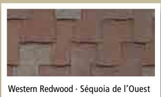
Western Redwood - Séquoia de l'Ouest