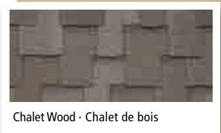
Chalet Wood - Chalet de bois