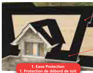
1. Eave Protection 1. Protection de débord de toit

IKO se sert de la technologie la plus avancée pour concevoir ses bardeaux Crowne Slate, Armourshake, Royal Estate, Grandeur*, Cambridge et Marathon; les consommateurs qui exigent la meilleure qualité, durabilité et valeur les choisissent. Couplé aux bardeaux de qualité de IKO, le système « Pro 4 » comprend ces produits complémentaires.