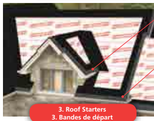
3. Roof Starters 3. Bandes de départ

Pour une protection totale du support de toit.