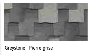
Greystone - Pierre grise