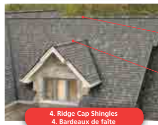
4. Ridge Cap Shingles 4. Bardeaux de faite

C'est rapide, facile et pratique. Ils sont déjà taillés et prêts à poser pour économiser un temps précieux dès le premier rang.