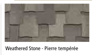
Weathered Stone - Pierre tempérée